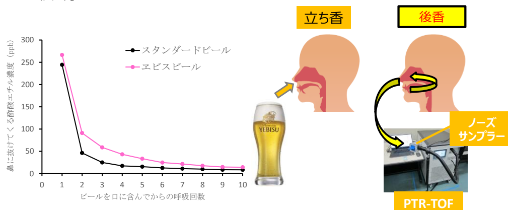
図1 エステル香に寄与する成分（酢酸エチル）の「後香」の経時変化

直接感じる「立ち香」に対し、飲用後、口中から鼻腔にぬける「後香」はごくわずかな量であるため、これまで分析が困難でした。そこで、最新の分析機器「プロトン移動反応 TOF 質量分析計（PTR-TOF）」（注3）を用い、ビールの「リアルタイム香気分析」を行うことで、ビール飲用後の「後香」の成分を個別に数値化し、経時変化を評価しました。その結果、各成分の変化はビールの銘柄ごとに異なり、特にエビスビールでは「後香」として「エビス香」の一部である「エステル香」に寄与する成分がより長い時間残ることが明らかになりました（図1）。